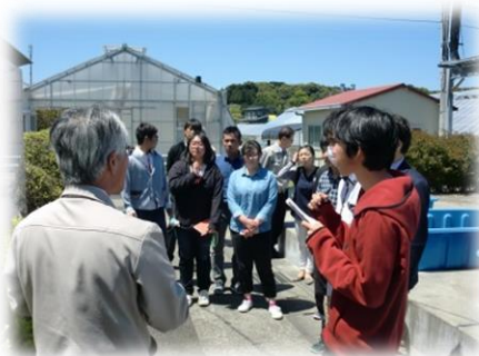
所長さんが自ら施設案内をして下さいました