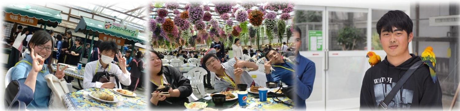
※掛川花鳥園でのひととき