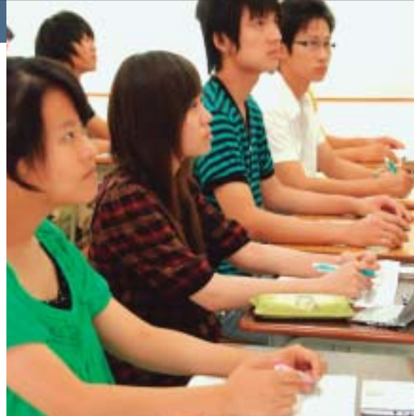
NAKANO GAKUEN ACADEMY OISCA COLLEGE FOR GLOBAL COOPERATION