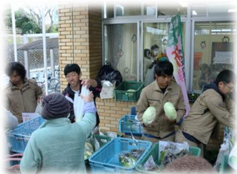
←開店と同時にたくさんのお客様がみえました。学生の皆は接客が得意です！落ち着いて丁寧に対応ができました♪