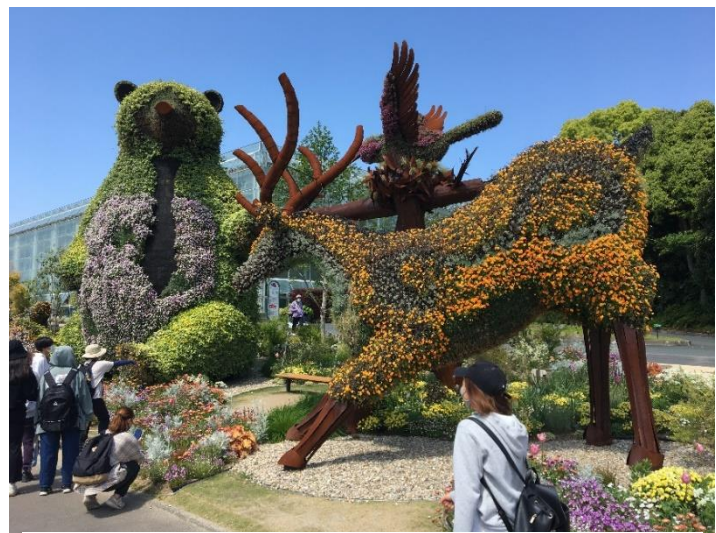
大型モザイカルチャー(花や緑を組み合わせ、特性を生かしてモザイク状に配置した立体造形物)