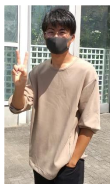
隣接の動物園にも足を伸ばし、学生同士の親睦を深めました