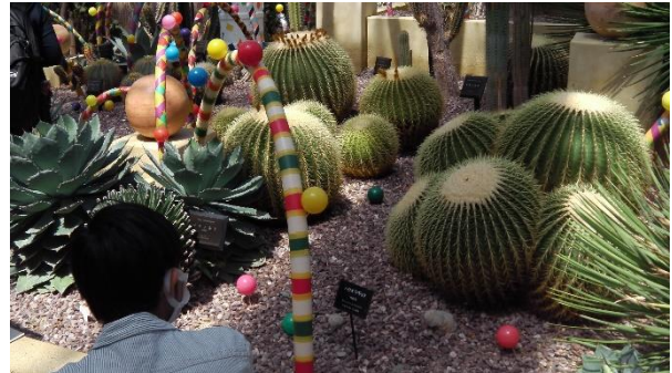
メキシコ風ブース