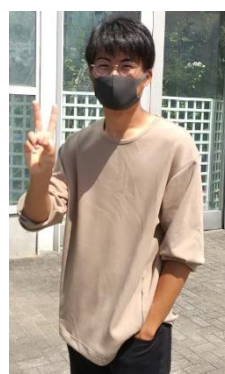
隣接の動物園にも足を伸ばし、学生同士の親睦を深めました