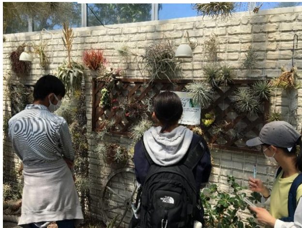
エアープランツ鑑賞ブース