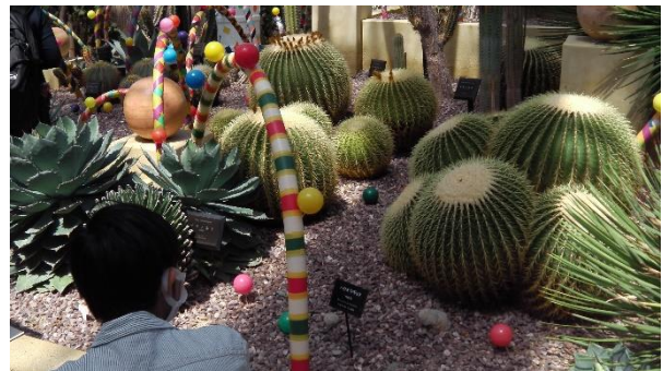
メキシコ風ブース