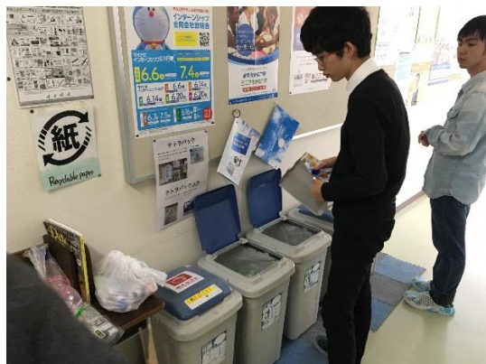
1年生 ゴミの分別 3R活動