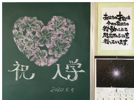
チューリップも新入生を出迎えてくれました♪