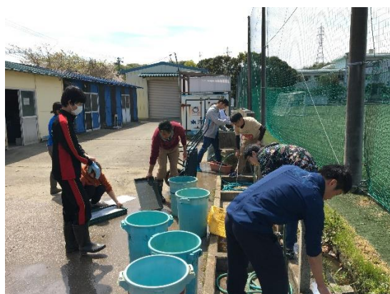
農業実習（稲苗作りの準備）