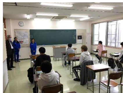
インド留学生と交流